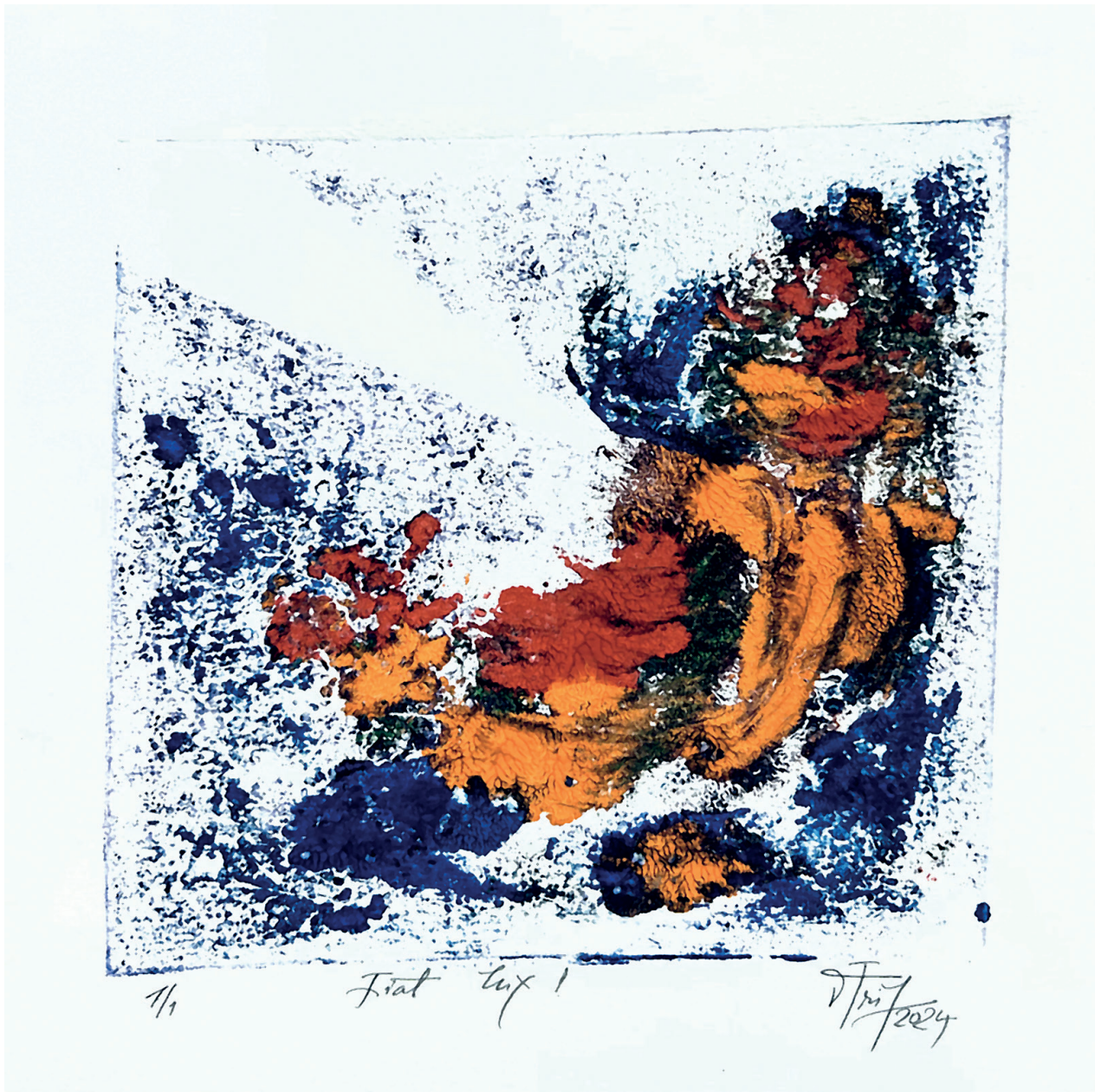
2024. Acrylique sur papier, 7 x 7 po.