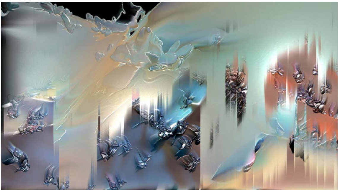
2018. RADIANCES II. Impression numérique tirée de vidéo HD