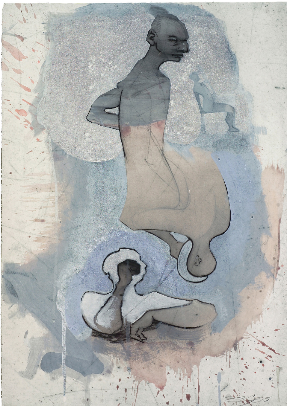
2005. Pierre noire, acrylique et gesso sur papier collé (passage sous presse), 59 x 41 cm.