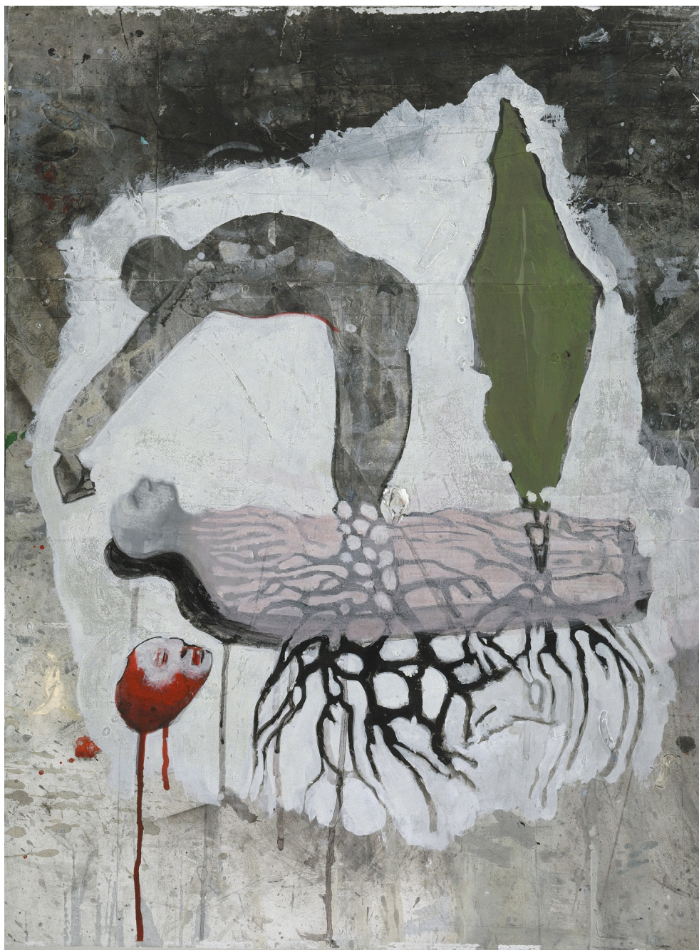
2010. Pierre noire , acrylique et gesso sur carton (passage sous presse), 69 x 43.5 cm.